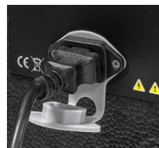
Presenza della corrente posizionata sul retro del contenitore.